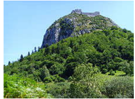
Marc Augier erzählt, Himmlers SS habe den Gral in der Montségur-Region gefunden.

Suchtrupp zur Burg Montségur geschickt, dem es gelungen sei, den Gral zu bergen und in Hitlers Kehlsteinhaus bei Berchtesgaden als neue Gralsburg zu bringen. Nach Kriegsende sei der Gral in einem Gletscher des Tiroler Hochfeilers versenkt worden. [84]