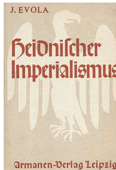
Deutsche Ausgabe (1933) von Evolas Imperialismo pagano (1928)

den Großkirchen beider Konfessionen. [21] Trotz zeitweiliger Unterstützung einzelner Gruppierungen durch das NS-System erfüllten sich diese Hoffnungen jedoch insgesamt nicht. Die Ariosophen hatte Adolf Hitler bereits in Mein Kampf (1925/26) als einen Haufen von Wirrköpfen bezeichnet. [22] Hitler war zwar von ihren manichäischen und millenaristischen Motiven beeinflusst, die ariosophischen Vorstellungen von einem prähistorischen Goldenen Zeitalter, einer gnostischen Priesterschaft und Orden, die ein geheimes Erbe hüten, teilte er jedoch nicht. [23] Nach der Machtergreifung wurden ariosophische Gruppierungen neben allen anderen okkultistischen sowie freimaurerischen und etlichen religiösen Gruppen als „staatsfeindliche Sekten“ eingestuft und zunächst vom Sicherheitsdienst des Reichsführers SS beobachtet. [24] Mit einem Erlass vom Juli 1937 wurden dann alle derartigen „Sekten“ verboten. [25] 1938 betonte Hitler: „Das Einschleichen mythisch veranlagter okkulten Jenseitsforscher darf daher in der Partei nicht geduldet werden.“ [26]